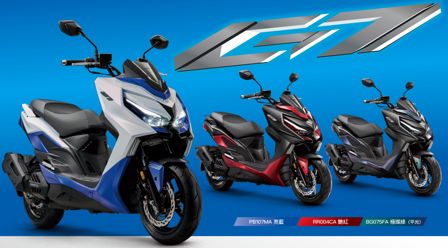
PB107MA 亮藍 RR004CA 艷紅 BG075FA 極璨綠 (平光)