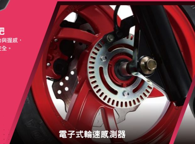
電子式輪速感測器