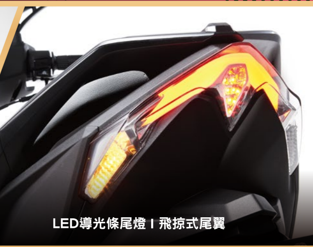
LED導光條尾燈 | 飛掠式尾翼