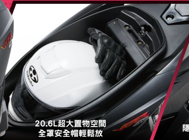
20.6L超大置物空間 全罩安全帽輕鬆放