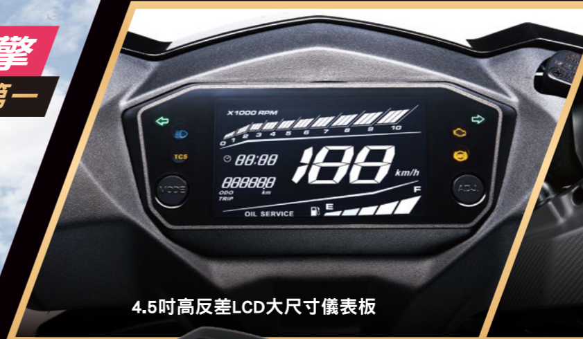
4.5吋高反差LCD大尺寸儀表板