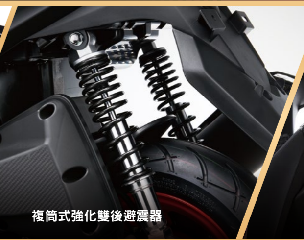
複筒式強化雙後避震器