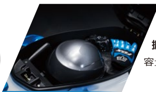
擴增置物大空間 容量提升，收納更方便