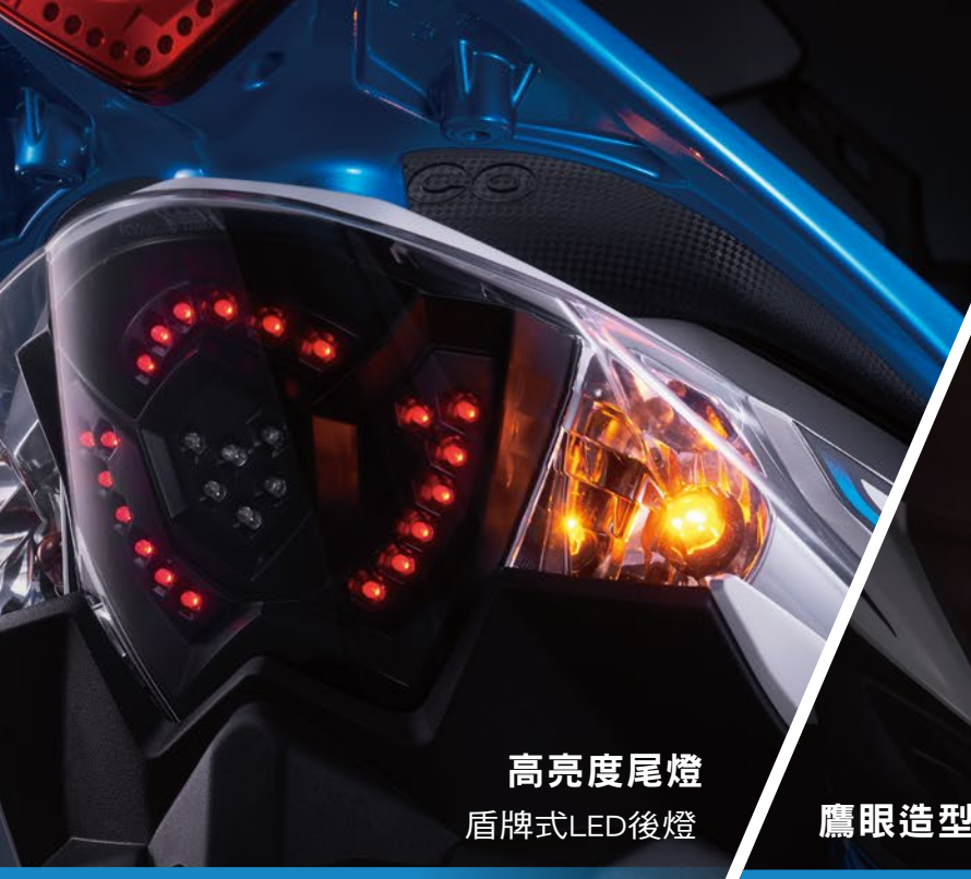
高亮度尾燈 盾牌式LED後燈