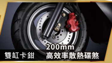
200mm 雙缸卡鉗 高效率散熱碟煞