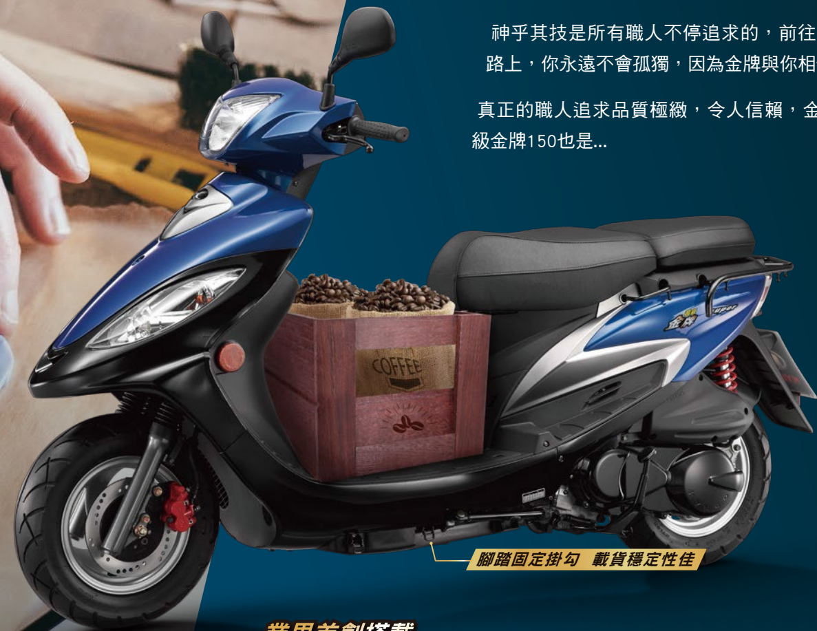
腳踏固定掛勾 載貨穩定性佳