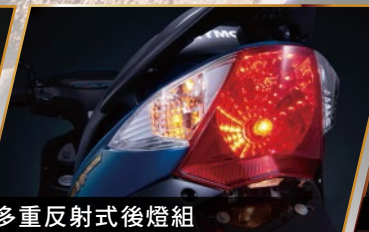
多重反射式後燈組