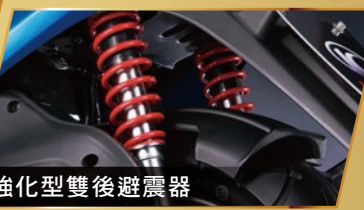
強化型雙後避震器