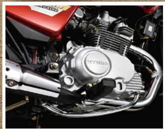
▶ 大力士引擎 超勇猛

大力士五期噴射FI引擎，超強猛的動力心臟，提供更大扭力輸出，貨物載重載多照樣耐操有力，真正省油，保養不費力！