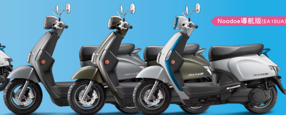
WN263FA 霧鑽銀 WG531FA 平光墨綠 NH193PA 珍珠白