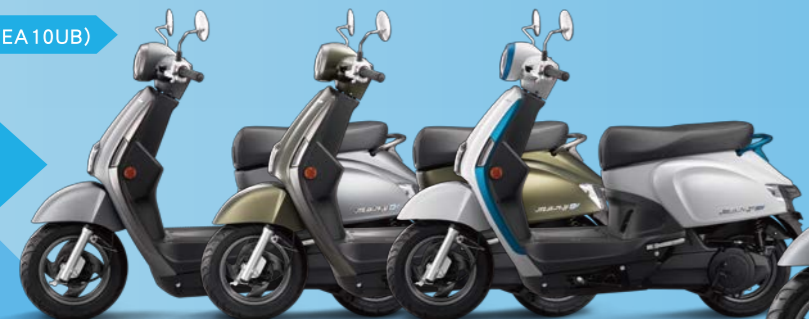
WN263FA 霧鑽銀 WG531FA 平光墨綠 NH193PA 珍珠白